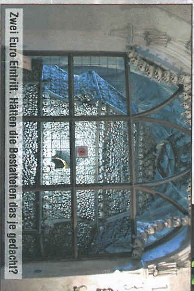
Zwei Euro Eintritt. Hätten die Besatzen das je gedacht?

Der Legende nach wurde Heinrich, ein Abt des Zisterzienser Klosters Sedletz, um 1278 von König Ottokar II. Premysl von Böhmen mit einer Botschaft nach Jerusalem entsandt. Auf seiner Rückreise brachte der Abt eine Handvoll Erde vom Kalvarienberg mit und verteilte diese über den Klosterfriedhof, der dadurch zu heiligem Boden erklärt wurde. Aufgrund der Pestepidemien in der Mitte des 14. Jahrhunderts (hierdurch zählte der Friedhof bereits etwa 30.000 Tote) und der Hussitenkriege im 15. Jahrhundert, die mehrere tausend Opfer forderten, musste