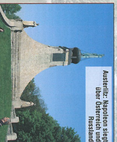
Austerlitz: Napoleon siegt über Österreich und Russland

mir) auf dem Pratzberg (tsch. Pracký kopeč). Die vier Statuen des Grabhügels symbolisieren die Gefallenen Frankreichs, Österreichs, Russlands und das männliche Schlachtfeld. Im Inneren des Grabhügels befindet sich eine kleine Kapelle mit einem Totenhaus mit den Gebirgen Gefallener. Wer möchte, kann auch noch den kleinen zugehörigen Museum einen Besuch abstatten. Neben dem Verlauf der Schlacht werden hier zeitgenössische Waffen und Ausrüstungsgegenstände gezeigt.