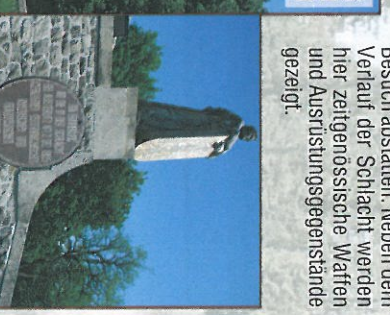
Grabhügel des Friedens